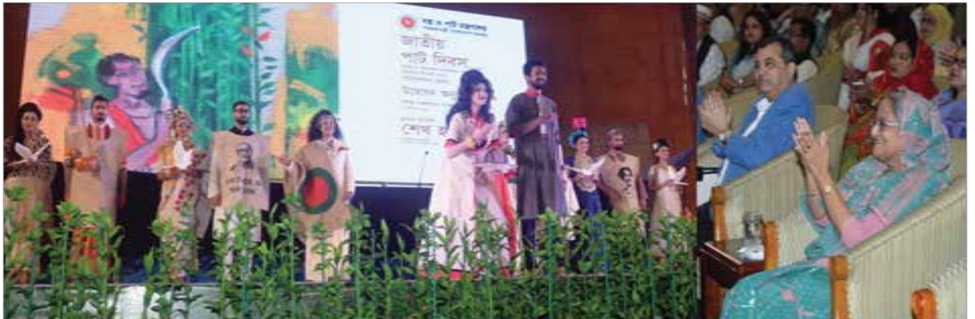
পাট দিবস উপলক্ষে আয়োজিত সাংস্কৃতিক অনুষ্ঠান উপভোগ করছেন মাননীয় প্রধানমন্ত্রী

এ দিবস উদযাপন উপলক্ষে গ্রহণ করা হয়েছিল ১০ দিন ব্যাপী নানা কর্মসূচি। পাট দিবসের গুরুত্ব ও পাট সংক্রান্ত বিষয়ে আগ্রহ সৃষ্টির লক্ষ্যে স্কুলের শিক্ষার্থীদের নিয়ে রচনা প্রতিযোগিতার আয়োজন করা হয়। দুই গ্রুপে এ প্রতিযোগিতায় বিজয়ী ৬জনকে ৬ই মার্চের পাট দিবসের অনুষ্ঠানে পুরস্কৃত করেন মাননীয় প্রধানমন্ত্রী। এছাড়াও ১১টি ক্যাটাগরিতে আরও ১২ জনের হাতে পাট দিবসের পুরস্কার তুলে দেয়া হয়। পুরস্কার বিতরণী অনুষ্ঠানের পর পাটপণ্যের অতীত, বর্তমান ও ভবিষ্যৎ নিয়ে একটি প্রামাণ্য চিত্রও প্রদর্শিত হয়। পাটপণ্য মেলার শুভ উদ্বোধনের পর প্রধানমন্ত্রী বিভিন্ন স্টল ঘুরে দেখেন এবং বন্ত্র ও পাট মন্ত্রণালয় আয়োজিত বর্ণাঢ্য সাংস্কৃতিক অনুষ্ঠান উপভোগ করেন।