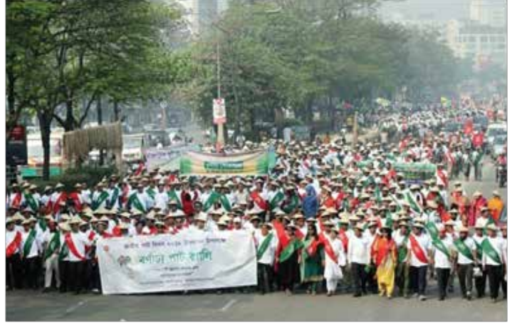
৬ই মার্চ জাতীয় পাট দিবস উপলক্ষে বর্ণাঢ্য র্যালি