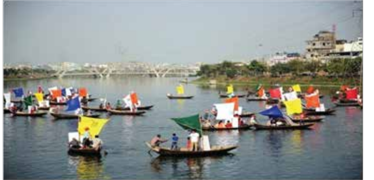
হাতির ঝিলে নৌ র্যালি