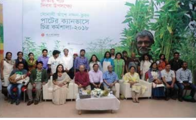
দেশবরেণ্য চিত্রশিল্পীদের নিয়ে পাটের ক্যানভাসে আর্ট ক্যাম্পিং