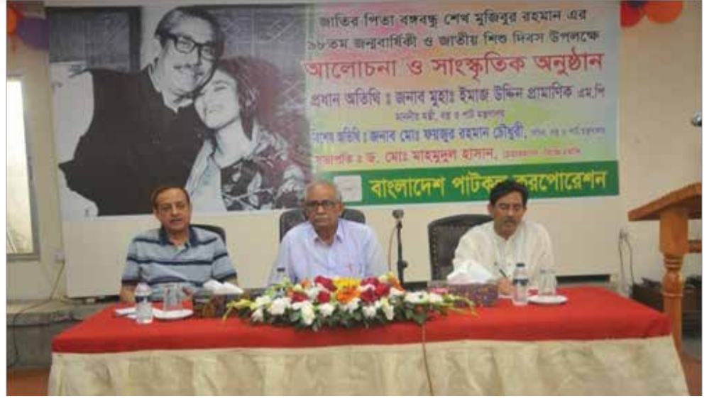
অনুষ্ঠানে বঙ্গ ও পাট মন্ত্রণালয়ের মাননীয় মন্ত্রী, মাননীয় সচিব এবং বিজেএমসি'র চেয়ারম্যান