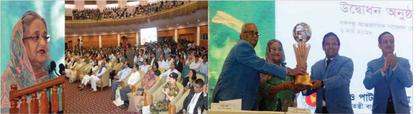
৬ই মার্চ জাতীয় পাট দিবস ২০১৮ এর শুভ উদ্বোধন করেন গণপ্রজাতন্ত্রী বাংলাদেশ সরকারের মাননীয় প্রধানমন্ত্রী শেখ হাসিনা

বাংলার পাট তার ক্রান্তিকাল পেরিয়ে আবারও নতুন সম্ভাবনার মুখ দেখছে। গ্রিন ইকোনমি, ন্যাচারাল ফাইবারের ব্যাপক চাহিদা ও সরকার কর্তৃক নানামুখী পদক্ষেপ গ্রহণের ফলে বাংলাদেশের সোনালী আঁশ হিসেবে খ্যাত “পাট” তার হারানো গৌরব ফিরে পেতে শুরু করেছে। এরই ধারাবাহিকতায় অভ্যন্তরীণ ও আন্তর্জাতিক বাজারে পাটের রপ্তানি বাড়ানোর লক্ষ্য নিয়ে গত ০৬ই মার্চ সারাদেশে দ্বিতীয়বারের মতো বঙ্গবন্ধু আন্তর্জাতিক সম্মেলন কেন্দ্রে উদযাপিত হলো জাতীয় পাট দিবস ২০১৮। অনুষ্ঠানের শুভ উদ্বোধন করেন গণপ্রজাতন্ত্রী বাংলাদেশ সরকারের মাননীয় প্রধানমন্ত্রী শেখ হাসিনা। এবার এ দিবসের প্রতিপাদ্য বিষয় ছিল “সোনালি আঁশের সোনার দেশ, পাট পণ্যের বাংলাদেশ”।